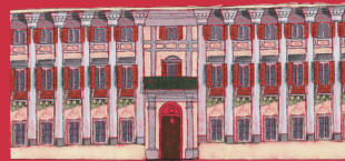
5) PALAZZO VICEREGGIO